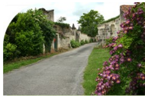
▶ Les ruines du Château du Breuil