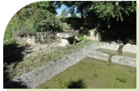
Le lavoir des Limbaudières