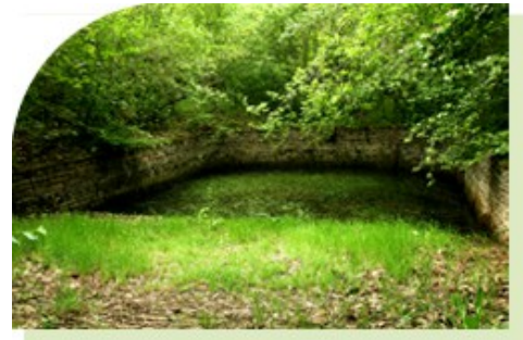
La fontaine des Cornouillers