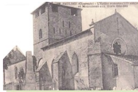
▶ Carte ancienne de l'Église de Jauldes

Le nom de Jauldes, dans les premiers siècle de notre ère était Gald ; il venait d'un sénateur romain qui y possédait une villa. Le bourg, si l'on en juge les débris de construction qu'on découvre dans les champs qui l'entourent, devait être beaucoup plus étendu qu'il ne l'est aujourd'hui. Jauldes fut canton dépendant de La Rochefoucauld.