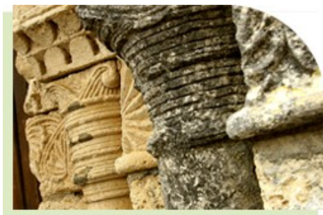
▶ Chapiteaux à volutes et motifs floraux des colonnes de la façade