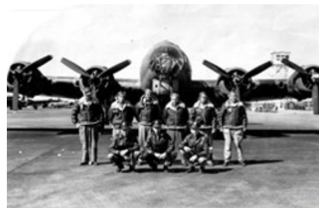
▶ Pilote et équipage de la forteresse volante