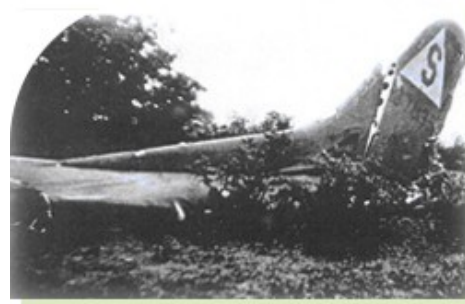
▶ Débris du Channel Express III

Félicitations vous avez trouvé la cache !