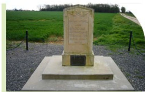
▶ Stèle des Américains

Rendez-vous aux coordonnées GPS ci-dessous pour découvrir l'histoire du Channel Express III : N45°48.262 E000°14.439