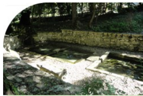
Le lavoir des Brissauds