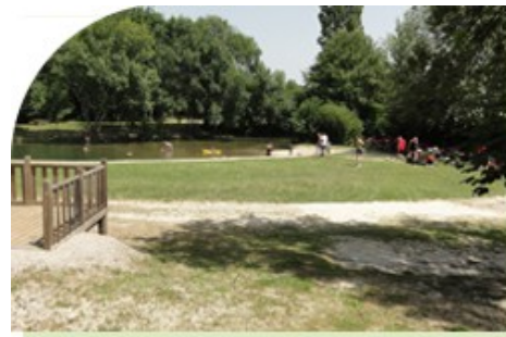
La baignade de Marsac